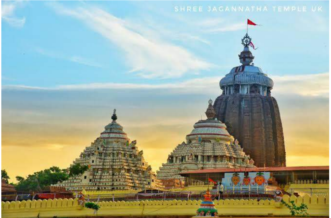
ପୁରୀ ଶ୍ରୀମନ୍ଦିର ଢାଞ୍ଚାରେ ଲଣ୍ଡନ ମନ୍ଦିର